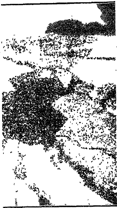
मुजफ्फरपुर का पोलो मैदान